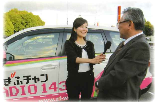
ぎふチャンのインタビューを受ける劇場支配人

映画協会では、地元岐阜放送のラジオ放送「ぎふチャン」と提携して、毎月末の月曜日夕方5時から組合加盟の映画館に「ラジオカー」を派遣、リポーターが現場から生放送を行っています。リスナーの皆さんにアピールしたい映画の紹介やイベントなど盛りだくさんでタイムリーな旬の話題を劇場支配人やスタッフ自らが出演し、インタビューを交えてお話をしています。おかげさまで、この番組コーナーは好評で、今年で9年目を迎える長寿番組になっています。