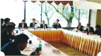
岐阜ブロック会場