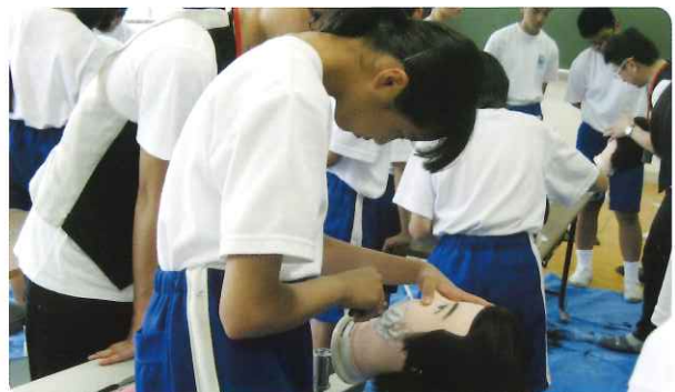
シェービングの実習

その後、生徒が自らウィッグ(マネキン)を使ってカット・セット・シェービング及びエステなど理容技術