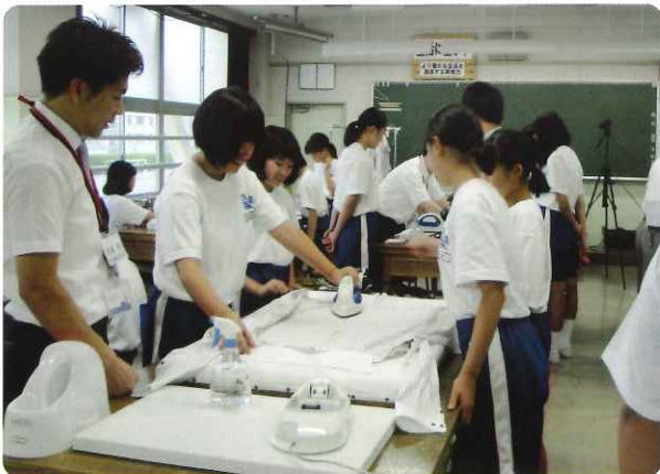
ワイシャツのアイロンがけ実習

シャツのアイロンがけを体験しました。生徒は、アイロンの持ち方からアイロンがけのコツを実体験しながら、熱心に実習に取り組んでいました。