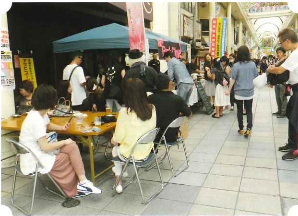
組合カクテル「ピンククローバー」の出店

毎年10月に岐阜市内で開催される「信長まつり」では、例年、組合オリジナルカクテルの「ピンククローバー」等カクテルPRのため、柳ヶ瀬本通り「柳ぶら楽市」において当組合が出店しています。当日は、地元の材料を組み合わせで作った「ピンククローバー」のほか5種類のカクテルを用意し、また、おつまみとして「スパイシーソーセージ」、「ラム肉カレー」、「ロールキャベツ」等、さらには生ビールなども提供して、大変な盛況となりました。