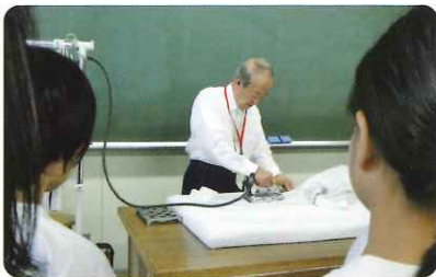
講師によるデモンストレーション

始めに、組合講師からクリーニング業の魅力、イメージのPRなどクリーニング業について講義を行い、デモンストレーションとして組合講師から実際のワイシャツの業務用アイロンがけを、間近で披露しました。その後、講師陣の現地指導を得ながら、実際に、生徒がハンカチやワイ