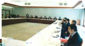
下呂ブロック会場

この会議には、県生活衛生課、指導センター、金融公庫、NHK等の関係者を招へいして、最新の情報を組合員に直接提供して頂き、組合員には大変好評を頂いています。また、インバウンドの増加に対処する施設案内、安全の手引等のパンフ資材も提供して、お客さまに安心して利用頂けるよう、真心を込めた「おもてなし」を目指しています。