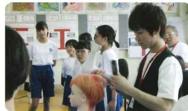
セットのデモンストレーション

最初に、理容業の魅力・イメージPRなど理容業について、ビデオを用いながら講義を行い、講師自らセットなどの技術デモンストレーションを間近で見てもらいました。