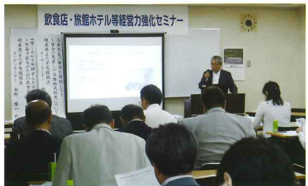
よろず支援コーディネーターによる講演（高山会場）

このセミナーは、関係行政機関を始め、岐阜県食品衛生協会、岐阜県よろず支援拠点及び関係金融機関の協力のもと、特に飲食関係、旅館ホテル関係を対象として、6月、7月の2回開催し、合計約80名の関係事業者の方々の参加を頂きました。