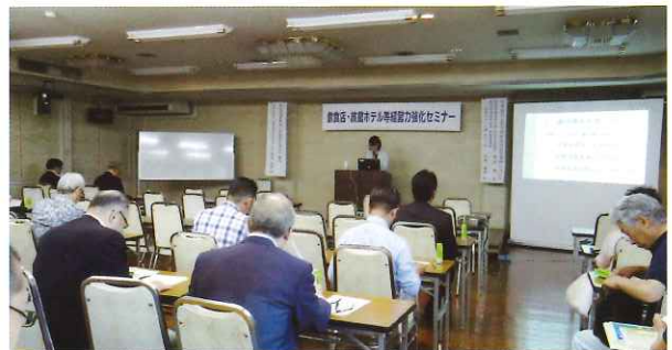
岐阜労働局職員による講演（大垣会場）

このような状況をうけ当指導センターでは、全国指導センターの委託により、関係生活衛生業者を対象に、経営力強化の一環として最低賃金の引き上げや雇用環境の改善のための助成金制度の周知、また雇用環境の改善による経営力向上を目指した「経営力強化セミナー」を開催しました。